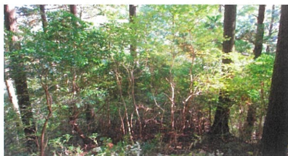
(森林資源活用) 近景 図面上②