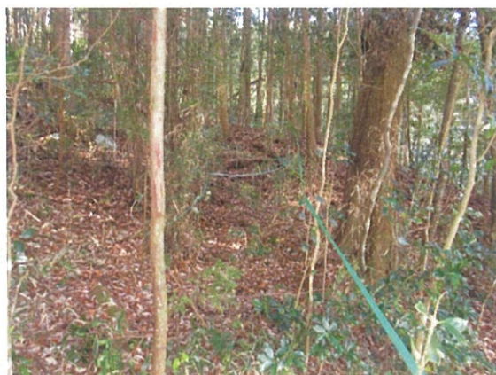
(機能強化)作業道開設 中間点