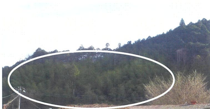
(竹林資源活用) 遠景 図面上③から 18 に向かって