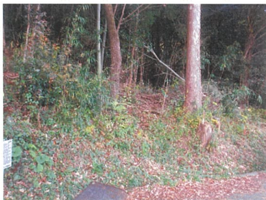
(機能強化)作業道開設 起点 図面に路網図示