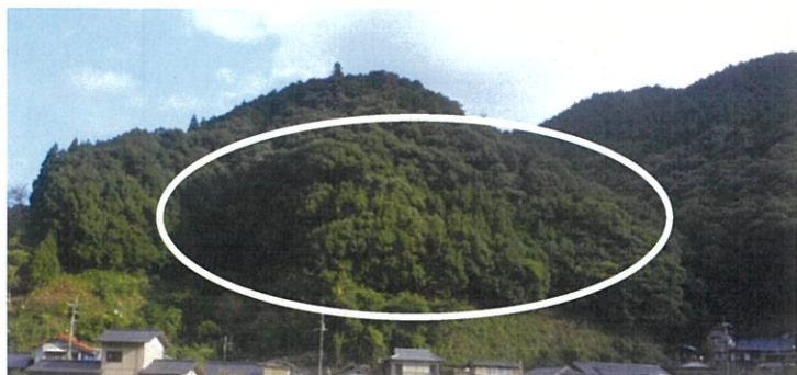
(森林資源活用) 遠景 図面上①から 25 に向かって